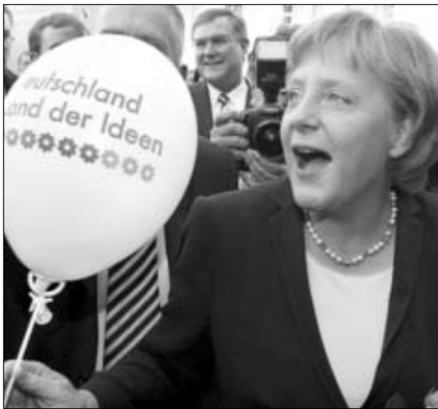
Ist doch eigentlich „denk mal!“ genug?

Einheitsverdrossenen Ostdeutschen wurde mittels Bundestagsbeschluss ein Freiheitsdenkmal verordnet