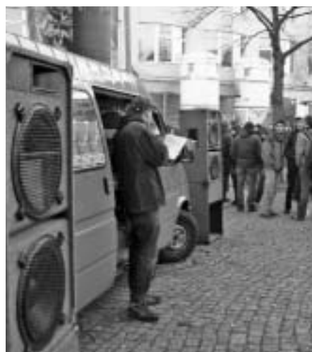
Lautsprecher mit Kultur gegen Unkultur