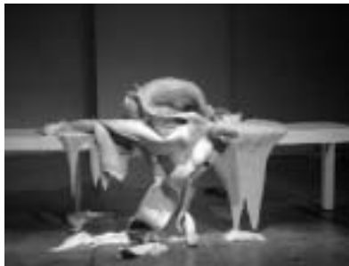
Die Häutung als Beginn der Emanzipation? Oder der Anfang vom Ende der Freiheit?

Euro-scene - das 17. Festival zeitgenössischen Theaters hat, trotz des widersprüchlichen Mottos „Spaltungen“, der europäischen Einheit in der kulturellen Vielfalt gehuldigt. Denn die Lesarten, die Ausdrucksmöglichkeiten, die Spannungen ergeben ein variantenreiches Stimmungsbild aktueller Entwicklungen.