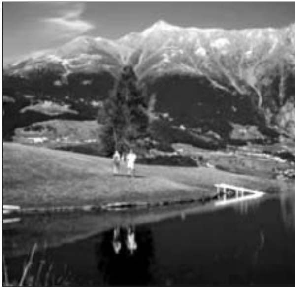
Berge, Wasser, Wandern – das ist nicht das ganze Österreich

Die Sache hat zwei Seiten: Der Fall hat eine Diskussion entfacht, die nun höchststrichterlich festgestellt einen neuen, menschlicheren Umgang mit Asylbewerberinnen zur Folge hat: Es gilt bei der allfälligen Gewährung eines Bleiberechts ab sofort das Prinzip der „Gesamtbetrachtung“ der Umstände und keine kalte Rechtsaus-