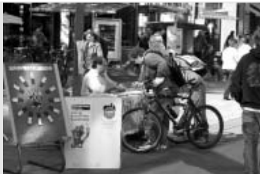
Die einen wie die anderen Unterschriften „ohne Belang“, Herr OBM?