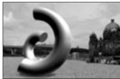
Erster Preis für diesen Entwurf eines Freiheits- und Einheitsdenkmals

Das geplante „Freiheits- und Einheitsdenkmal“ ist allem Anschein nach insbesondere für die Ostdeutschen gedacht,