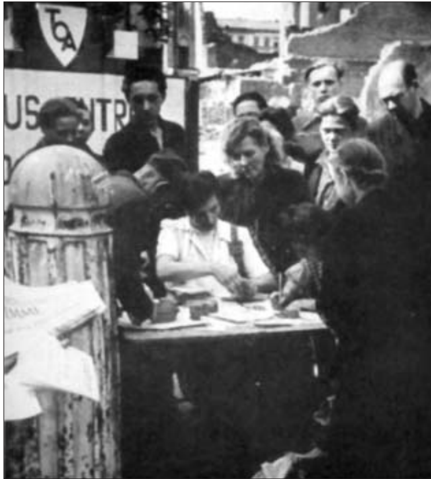
Im Osten Deutschlands geht der Kampf um die Einheit Deutschlands auch nach dem Scheitern des Volkskongresses weiter. Einwohner des französischen Sektors, in dem das Volksbegehren für eine unteilbare deutsche demokratische Republik verboten ist, zeichnen sich im sowjetischen Sektor Berlins im Mai/Juni 1948 in die Listen ein.

Aber im Westen war sie bereits fest beschlossen