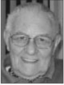
Von KLAUS HUHN